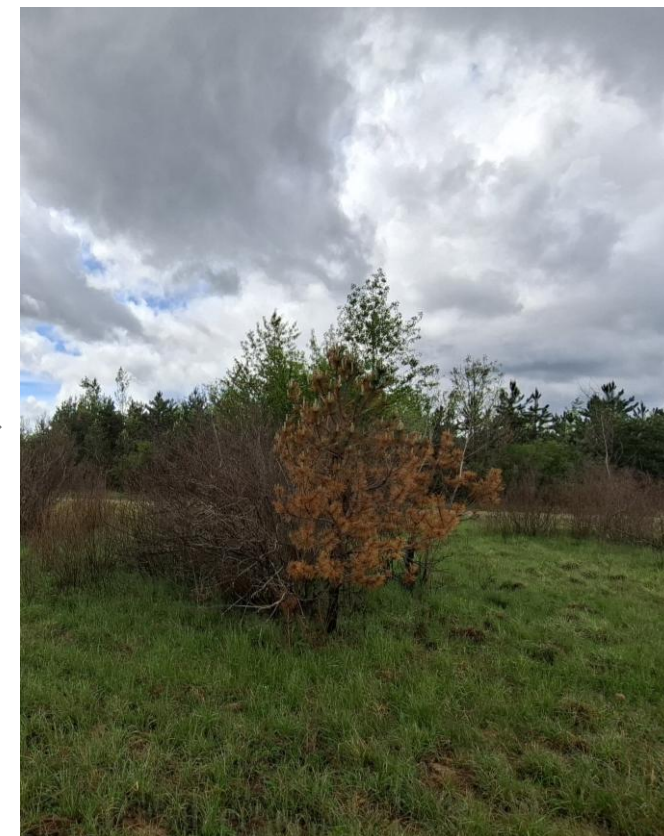
Vegetace: Předtím – Poté