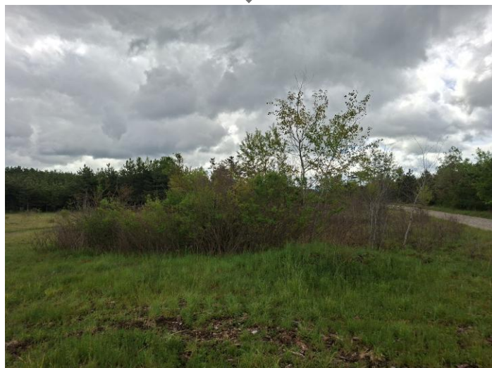
Vegetation: Vorher - Nachher