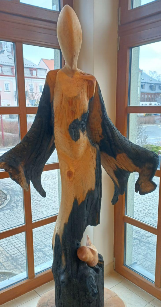
Statue aus Brandholz im Nationalparkzentrum in Krásná Lipá Socha z ohořelého dřeva v Centru národního parku v Krásné Lipě