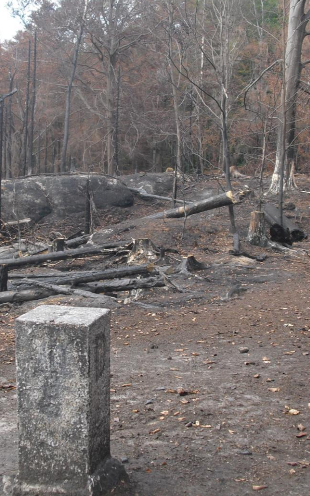
Grenzweg, Sächsisch-Böhmische Schweiz 2022 Hraniční cesta, Česko-saské Švýcarsko 2022